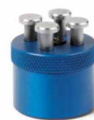
auf Anfrage On request