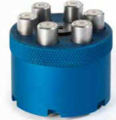
auf Anfrage On request