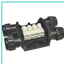
Morsetteria a molla Terminal block with spring